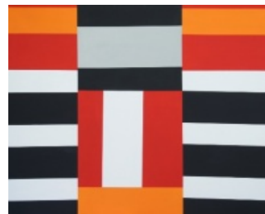
Rolandas Karalius „Raudona ir balta. Properša“. 2011 m. 120x150.

Rašoma, kad tai ne pirmas tapytojų darbų rodymas kartu, kad jie buvo draugais, nors ir skirtingų požiūrių, bet labai gerai sutarė ir pan. Būtų puiku, kad prie šios parodos prisidėtų ir sakytinė istorija: juk praėjusio šimtmečio neseną dailės istoriją galima padėti kurti prisiminimais, amžininkų nuomonėmis ir pokalbiais.