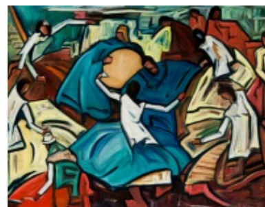
Jono Rimšos tapyba. Lietuvos išeivijos dailės fondas