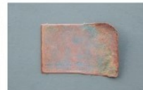
U.Mikuda. Laikas skrieja vėjo sparnais.