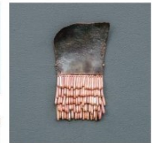
U.Mikuda. Baltijos žuvis.