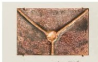
A.Roaloh. Trijų valstybių laiško turinį saugantis vokas.