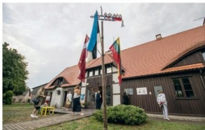
Tarpvalstybinėje emalio meno kūrėjų laboratorijoje „Pamario ženklai“ sukurtų emalio atvirukų / atviraiškų ekspozicija ant Vydo kultūros centro sienos lauke.